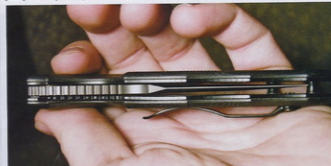
Edina nepopolnost, ki bi jo lahko očitali nožu, je bil položaj zaprtega rezila, ki na našem nožu ni popolnoma na sredji ročaja, kar pa bi lahko bila tudi posledica preti-rano navdušene uporabe.

Endura, ki se v žepu sicer nosi zelo podobno kot Bantay, a jo iz njega izvelcem precej lažje. Bantay ima namreč oblogo ročaja iz kompozita G10 z zelo grobo površinsko teksturo, k trenju pa pripomore tudi si-roka in močna jeklena nosilna sponka. Sponko lahko s tremi vijaki pritrudimo na levo ali desno stran ročaja, odvisno od strani nošenja. Ročaj je izrazito konične oblike, izrazit utor ob korenu rezila preha-ja v tri plitvije uture, v katerih pri spre-dnjem prijemu počivajo sredinec, prsta- nec in mezinec in se nad sponko zaključ-ja s konico, ki jo lahko tudi ob zaprtem rezilu uporabimo kot preprosto udarno orodje ali pa za izvajanje sofisticiranih pritiskov na specifične živčne točke. Ker pa se ro-čaj zaključ-ja z izmuzljivo konico, lahko nož