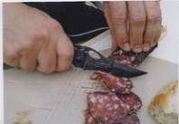
Ker ga bomo imeli verjetno več čas pri sebi, se bo oster zaklopnik večkrat kot v boju izkazal pri pripravi malice.