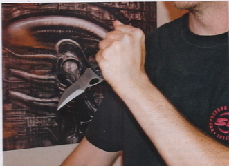
Bantay ali stražar je uporaben tudi pri tehnikah z obrnjenim prijemom, lažna ostrina na hrbtu rezila ni odveč.

uspeli niti dobro opraskati. Poleg tega, da rezilo s to prevleko zaradi zmanjšanega trenja precej lažje drsi skozi smog, ki jo režemo, je temna barva rezila zaželena tudi za morebitne taktične aplikacije.