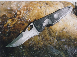
Bantay je že na prvi pogled nekaj posebnega, nenavadna je tako oblika rezila kot ročaja.

sopada tudi z njihovim resnejšim vstopom v izdelavo vojaških nožev. Gladke in tekoče linije Borutovega Suppressorja, kot se je imenovalo vitko bodalo v Extremini izlozbi, so predstavljale precejšnje odstopanje od njihovih drugih izdelkov – v pozitivnem smislu. Takrat smo zapisali, da so njihovi noži videti, kot bi bili namenjeni predvsem specialcem, kakršna sta filmska Rambo in Commando, pravzaprav pa so bolj verjetno pisani na kožo le ljubiteljem nožev tovrstnega, lahko bi rekli agresivnega videza. Bistvena postavka takšnega noža je kajpada oblikovanje in dobra končna obdelava, ne nazadnje pa štejeta tudi izbira materialov in vsaj navidezna funkcionalnost. Ekstremne dimenzije rezil, tako po dolžini kot po debelini, so vsekakor pripomogle k učinkovitosti izbranega recepta. Z malo zlobe smo takrat dodali, da Extremimim nožem za soočenje z ekstremnimi razmerami pravzaprav manjkajo le še vžigalice, laks in trnek, ki bi jih bilo mogoče spraviti v ergonomsko oblikovan ročaj. Nasprotno temu pa Suppressor prav z ničemer ni asociiral na slavni »Rambo nož«, pravzaprav je bil že na prvi pogled videti kot nož, zasnovan z zelo določenim ciljem. Extrema Ratio ga je predstavil kot bodalo protiteroristične enote italijanskih karabinerjev GIS (Gruppo Intervento Speciale). A ker se je takrat zataknilo že pri prvi komunikaciji s predstavniki podjetja - niso nam znali povedati niti imena oblikovalca