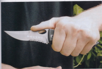
Pomen izreza na hrbtu rezila in rebrčenja na njem se razkrije, takoj ko zaklopnik vzamemo v roko.